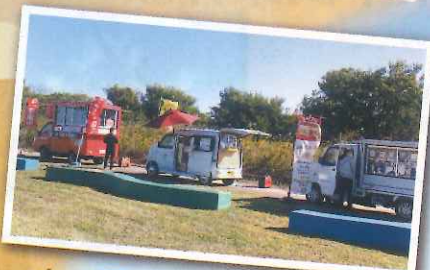
キッチンカーも大集合!