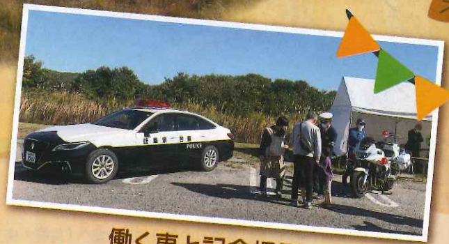
働く車と記念撮影