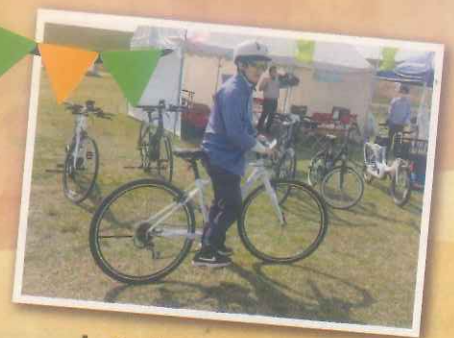
レンタサイクル・ 電動自転車体験