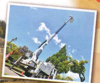
高所作業車試乗体験