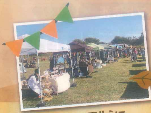
はしま de マルシェ